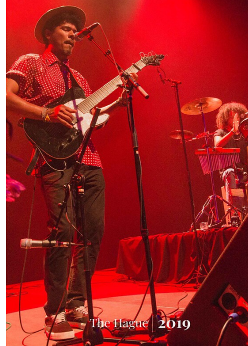
The Hague | 2019