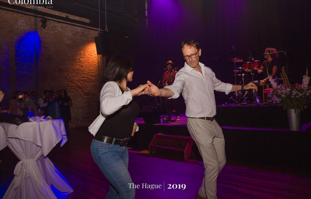
The Hague | 2019