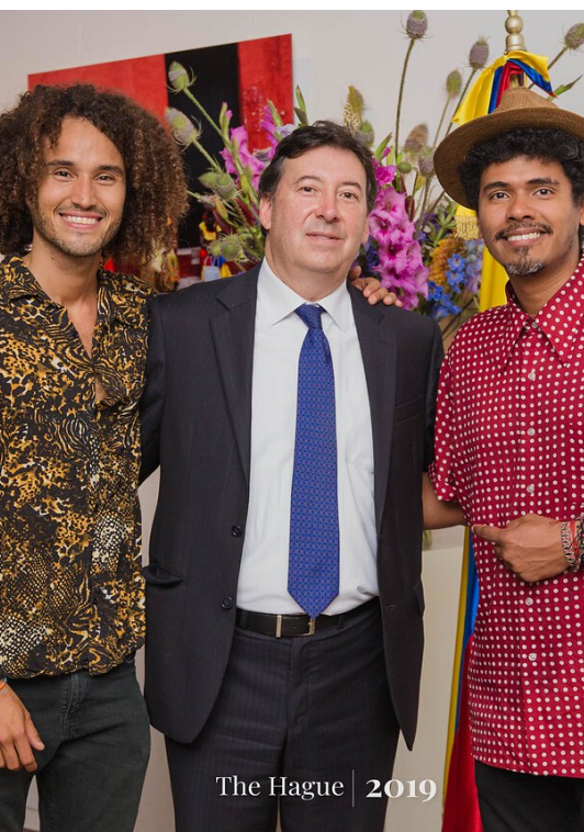
The Hague | 2019