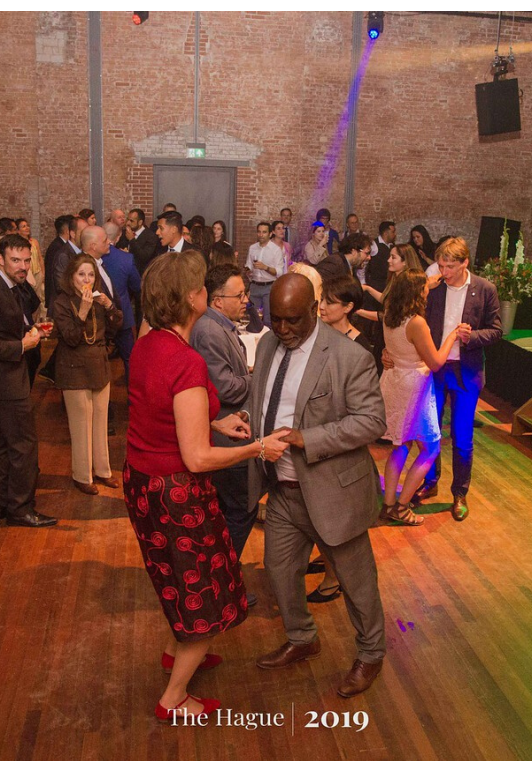
The Hague | 2019