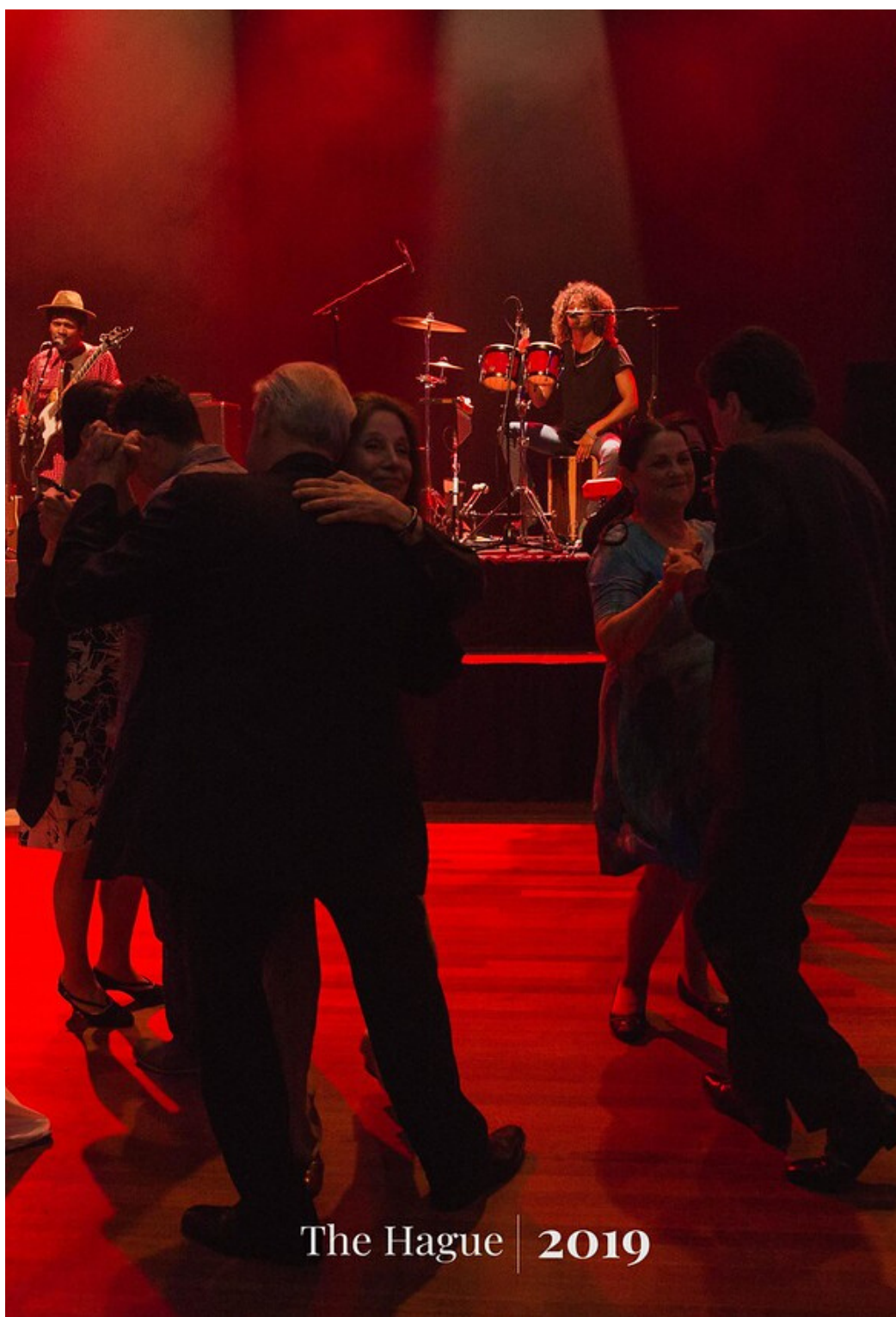
The Hague | 2019